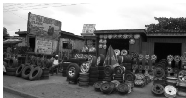
Auch Ghana ist ein typisches Wiederverwertungsland: Europäische Second-Hand-Autos werden hier in Einzelteilen wiederverkauft.

Im Aktionsplan an die Kirchen wird empfohlen, « sich am Protest der Menschen gegen wirtschaftliche Ungerechtigkeit und Umweltzerstörung in ihren Gemeinden durch Gebete, Predigt, Unterricht und konkrete Solidaritätsakte zu beteiligen ». Diese Empfehlung ist für die OeKU Ansporn und Bestätigung zugleich, ihrer Arbeit an der Schöpfungszeit und an weiteren Dokumenten für Predigt, Liturgie und Unterricht grosses Gewicht zu geben. Ebenso bestätigt Punkt 7, dass die OeKU mit ihren Energiekursen und anderen praktischen Aktionen in Gemeinden auf dem richtigen Weg ist: « die umweltschützenden Aktionen innerhalb aller Mitgliedskirchen zu verstärken, im Predigtgottesdienst, in der Ausbildung, der nachhaltigen Nutzung natürlicher Ressourcen, durch praktische Projekte und anwaltschaftliches Handeln .»