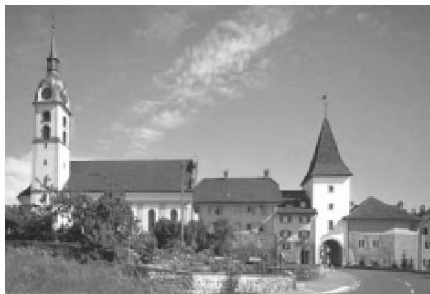
Auch der Turm der katholischen Kirche in Sempach bietet sich von seiner Lage her für die Installation einer Natelantenne an. Die Kirchgemeinde hat jedoch bisher auf Anfragen von Netzbetreibern aus ökologischen und ästhetischen Überlegungen mit Absagen reagiert.

Die Verantwortlichen einer Kirchgemeinde meinten zu einem Gesuch: "Wir haben es uns lange überlegt. Wir sind zum Schluss gekommen, dass der Kirchturm mit der eingebauten Antenne die gleiche Funktion übernimmt, wie er sie bereits vor dem Zeitalter der Telekommunikation hatte, nämlich die Aufgabe der Kommunikation". Die Kirchgemeinde erhält jährlich Fr. 3'500.-.