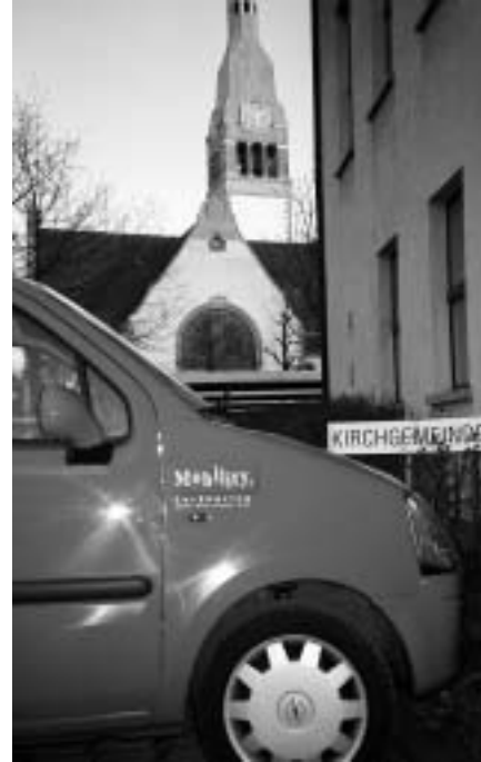
In der Stadt Bern befinden sich drei Mobility Parkplätze in unmittelbarer Nähe von Kirchen. Einer davon ist auf dem Gelände der Kirchgemeinde Paulus im Länggass-Quartier.

Kirchen sind als Standort ideal, da sie oft zentral liegen und über Parkplatzmöglichkeiten verfügen. Mobility ist besonders interessiert an Plätzen, die gut auffindbar und während 24 Stunden frei zugänglich sind. Im Idealfall ist der Parkplatz beleuchtet, liegt nahe einer Haltestelle des öffentlichen Verkehrs und darf von Mobility mit einer PP-Markierung versehen werden. Interessierte melden sich bei 0848 824 812, www.mobility.ch .