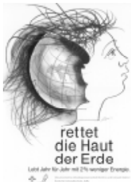
Die von der Konvention „Haut der Erde retten“ auf Plakaten und Postkarten eingesetzte Zeichnung wurde von Hans Erni gestaltet.

Beginn der Zusammenarbeit zwischen OeKU und AefU war 1990 der „Aufruf zur Rettung der Erdatmosphäre“. Die beiden Vereine wandten sich mit der Aufforderung zur Reduktion des Verbrauchs fossiler Energieträger an die Öffentlichkeit und vor allem an ihre Mitglieder. Gefordert war eine Selbstverpflichtung zur Reduktion des Energieverbrauchs von 2% pro Jahr. 1'500 Mitglieder der OeKU und der AefU unterzeichneten diese Selbstverpflichtung.