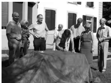
Der Rat des Schweiz. Evangelischen Kirchenbundes SEK unterzeichnet die Klima-Fahne am 1.9.2009.

Le conseil de la Fédération des Eglises Protestantes de Suisse FEPS signe le drapeau pour le climat le 1.9.09.