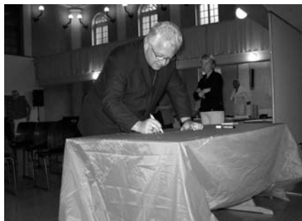
Bischof Markus Büchel unterzeichnet die Klima-Fahne an der Eröffnung der SchöpfungsZeit in St. Gallen.

Le conseil de la Fédération des Eglises Protestantes de Suisse FEPS signe le drapeau pour le climat le 1.9.09.