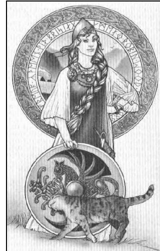
Freyja, Göttin der nordischen Mythologie