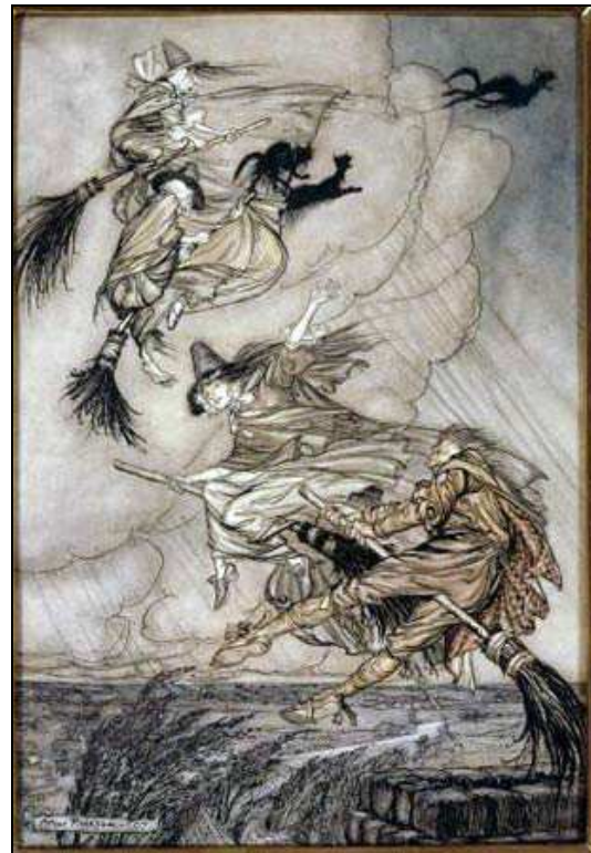
Illustration: Hexen fliegen mit ihren Katzen aus

Eine Katze, die das Haus eines kranken verlässt, kündigt dessen Tod an. Eine über den Weg laufende schwarze Katze bringt Unglück. Wer die Katze zum Wasser trägt, der trägt sein Glück aus dem Haus.