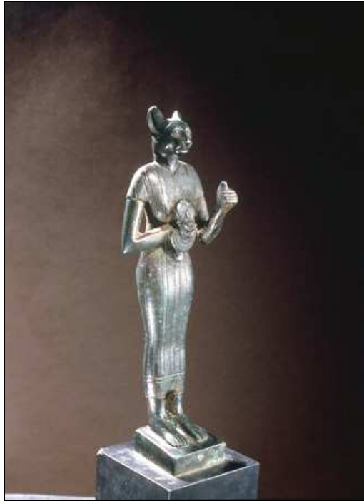
ägyptische Göttin Bastet