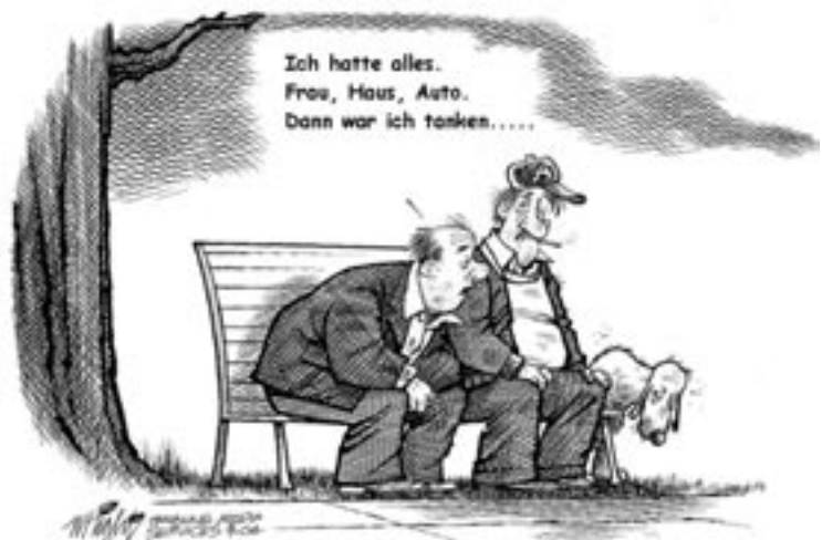
Benzinsorgen in den USA – und bei uns...?