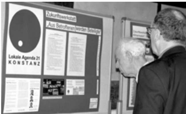
Zukunftswerkstatt am Kirchentag 2003 in Schaffhausen.

1992 wurde an der UN-Konferenz in Rio de Janeiro von den Staaten anerkannt, dass ganzheitliche Aspekte für die nachhaltige Entwicklung mit einbezogen werden müssen. Nachhaltigkeit umfasst also wirtschaftliche, ökologische und soziale Aspekte einer Organisation sowohl innerhalb der Organisation als auch in Beziehung zur Mitwelt. Nachhaltigkeit bedeutet somit auch, sich für eine Entwicklung einzusetzen, mit der alle beteiligten Partner zuversichtlich sein können.