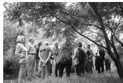
Unter Bäumen im Botanischen Garten.

aus aller Welt. Vom nordamerikanischen Mammutbis zum tropischen Ameisenbaum waren viele Entdeckungen möglich. Und ein wichtiger Hinweis für Käufer von Holz: Tropenholz hat wegen der fehlenden Jahreszeiten keine Jahrringe. So ist Tropenholz auch für Laien leicht erkennbar.