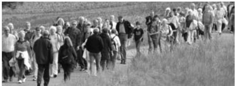
Seit 1993 empfiehlt die oeku die SchöpfungsZeit und erstellt dazu jährlich Aktionsmaterialien. Davon werden pro Jahr über 1000 verkauft – hauptsächlich an Pfarrpersonen. Nun wird die SchöpfungsZeit zunehmend auch von den offiziellen Kirchenleitungen anerkannt und zur Durchführung empfohlen. Bild: Teilnehmende an der Auftaktveranstaltung vom 1. September 2007 in Waldshut/Klingnau.

Wortlauts angenommen: «Angeregt von der europäischen ökumenischen Bewegung wird der Kirchenrat beauftragt, die Kirchgemeinden zum Feiern einer Schöpfungszeit zu motivieren. Er stellt ihnen dazu jährlich eine Liturgie zur Verfügung.»