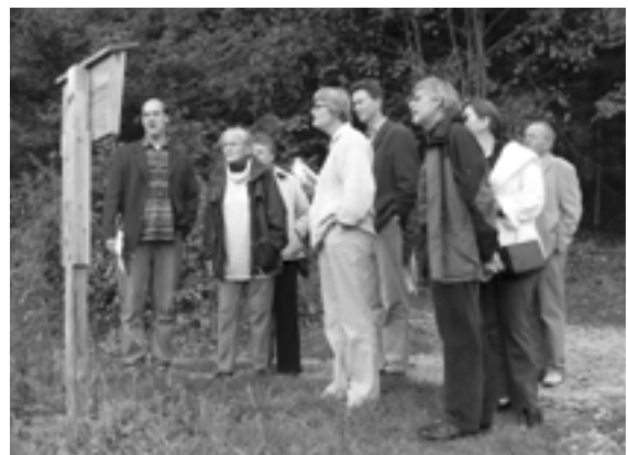
Die Vorstandsmitglieder nehmen sich Zeit für den «Chemin spirituel».

Die Retraite schloss mit einem Rundgang über den «Chemin spirituel», einen beschrifteten Weg, der Ökologie und Spiritualität zu verbinden versucht.